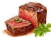
● ไก่ทานเนื้อวัว

ขอความกรุณาแจ้งวัตถุดิบที่ท่านแพ้หรือไม่สามารถรับประทานได้