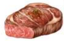
● ไก่ทานเนื้อหมู