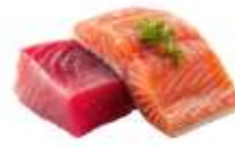
● ไก่ทานปลาดิบ