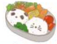
● อาหารสำหรับเด็ก ( 2-11 ปี ) *วัตถุดิบขึ้นอยู่กับทาว์ราน