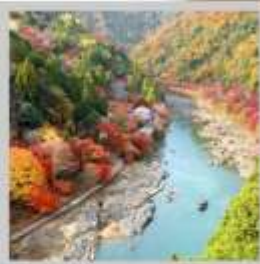
"ARASHIYAMA MT. KAMEYAMA"