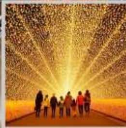
"NABANA NO SATO"