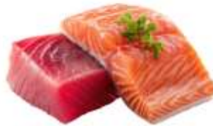
● ไก่ทานปลาดิบ