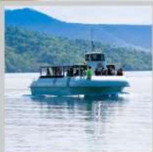
"LAKE SHIKOTSU GLASS BOAT"