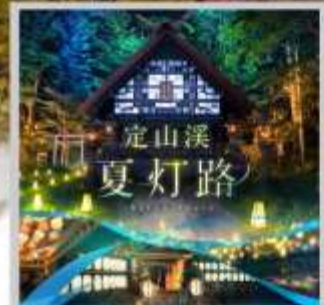
"JOZANKEI NATSU TOURO 2026"