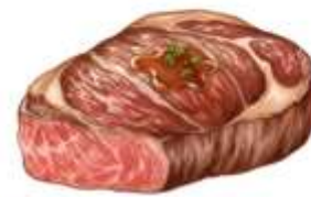
● ไก่ทานเนื้อหมู