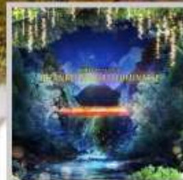
"JOZANKEI NATURE LUMINARIE"