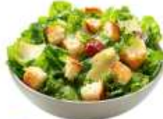
● ผักหรือผลไม้