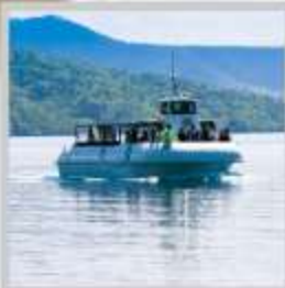
"LAKE SHIKOTSU GLASS BOAT"