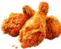
● ไส้ทานสัตว์ปีก (ไก่)