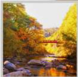
"JOZANKEI FUTAMI BRIDGE"