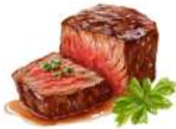
● ไส้ทานเนื้อวัว

ขอความกรุณาแจ้งวัตถุดิบที่ท่าน แพ้หรือไม่สามารถรับประทานได้