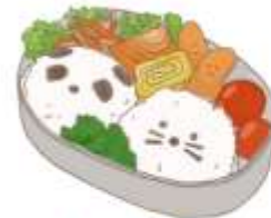
● อาหารสำหรับเด็ก ( 2-11 ปี ) *วัตถุดิบขึ้นอยู่กับทาว์ราน