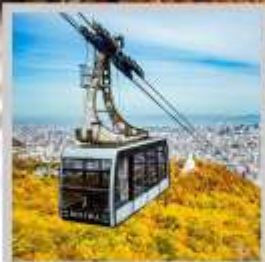
"MT. MOIWA ROPEWAY"