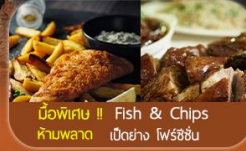
บิวฟิตซ์ !! Fish & Chips ห้ามพลาด เปิดอย่าง พิเศษขึ้น