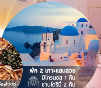
พัก 2 เกาะแสนสวย มีโครมอส 1 คืน ซานโตรินี 2 คืน