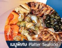
เมนูพิเศษ Platter Seafood