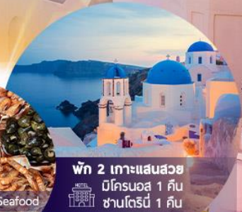
พัก 2 เกาะแสนสวย มีคอนอส 1 คืน ซานโตรินี 1 คืน