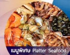
เมนูพิเศษ Platter Seafood