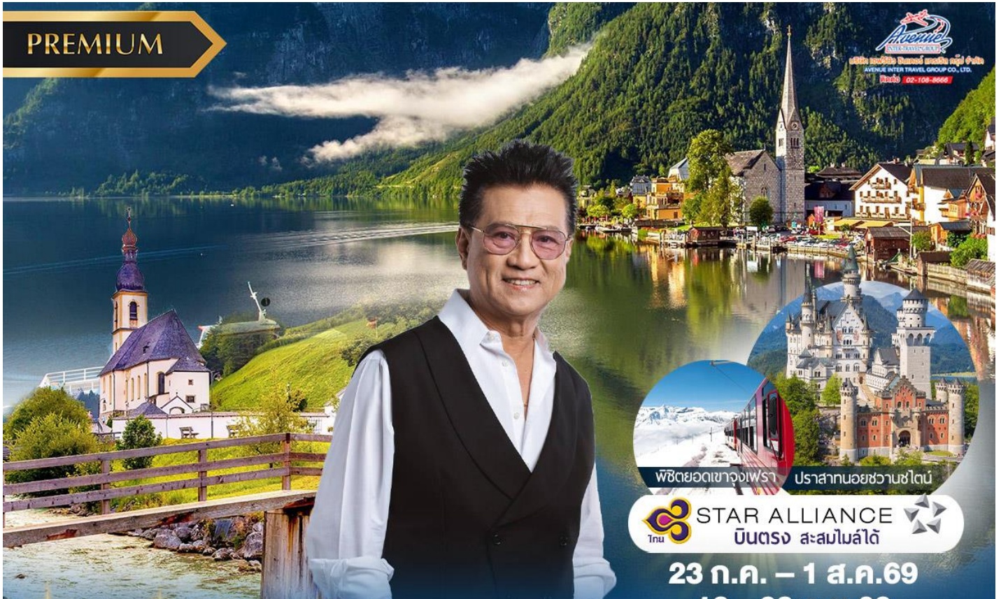
พีชียอดเขาของเฟรา