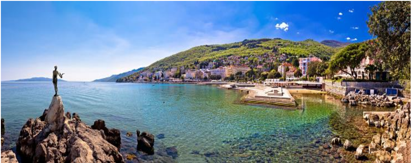
(ระยะทางประมาณ 174 กิโลเมตร ใช้เวลาในการเดินทางประมาณ 3 ชั่วโมง 15 นาที)

นำท่านเดินทางสู่ภาคตะวันตกของประเทศโครเอเชีย ซึ่งมีชื่อเรียกภูมิภาคนี้ว่าแคว้น “อิสเตรีย” เมืองแรกที่น่าท่านเยี่ยมชมคือ เมืองโอพาเทีย เมืองที่มีสมญานามว่า ไข่มุกแห่งทะเลอาเดรียติก ชื่อเดิมของเมืองนี้ ในภาษาอิตาลี คือ “Abbazia” ด้วยธรรมชาติอันบริสุทธิ์ประกอบด้วยอูร์ริมทะเลอาเดรียติก ที่มีวิลล่าหรูหราสไตล์ออสเตรีย จึงทำให้โอพาเทียเป็นเมืองท่องเที่ยวและพักผ่อนที่สำคัญที่สุดแห่งหนึ่งของโครเอเชีย จากนั้น นำท่านชมตัวเมือง แวะถ่ายรูปกับ รูปปั้นนางแห่งนกนางนวล เป็นรูปปั้นที่แกะโดย ZVONKO CAR เป็นรูปสลักริงดงามที่มินกนางนวลเกาะอยู่ที่มือ ซึ่งถือว่าเป็นสัญลักษณ์แห่งเมืองโอพาเทีย