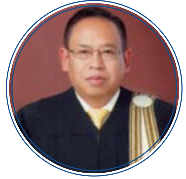
นายกองตรี รุนพล คงเจียง

รองอธิบดีกรมชลประทาน กรมชลประทาน กระทรวงเกษตรและสหกรณ์