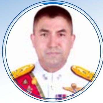
พลตำรวจเอก สุรเชษฐ์ หักพาล รองผู้บัญชาการตำรวจแห่งชาติ สำนักงานตำรวจแห่งชาติ