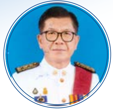
นายประภอบ สินะเสนันท์ ประธานศาลอุทธรณ์คดีชำนาญพิเศษ ศาลอุทธรณ์คดีชำนาญพิเศษ ศาลยุติธรรม