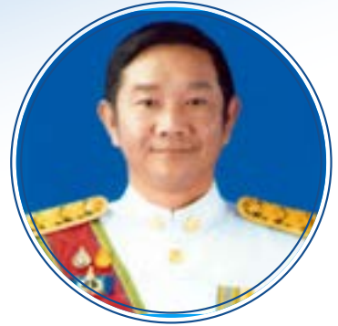
ร้อยตำรวจโท ภาพนก ชลาบุเคราะห์ รองอธิบดีกรมการปกครอง กรมการปกครอง กระทรวงมหาดไทย