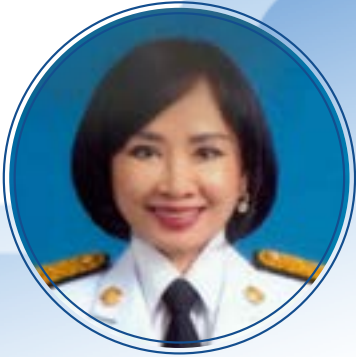
กัปตันแพทยหญิง สุนี จึงวิโรจน์ สมาชิกวุฒิสภา วุฒิสภา