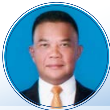
นายอนุพร อรุณรัตน์ สมาชิกวุฒิสภา วุฒิสภา