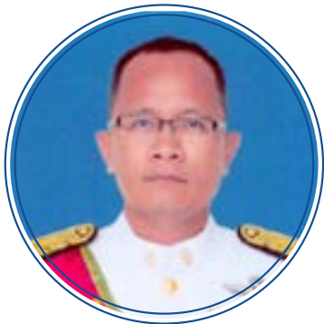
นายจตุพล ศรีบุรมย์ ตุลาการหัวหน้าคณะศาลปกครองกลาง ศาลปกครองกลาง