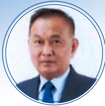
พลตำรวจตรี อังกูร คล้ายคลึง เลขานุการประธานกรรมการตรวจเงินแผ่นดิน สำนักงานการตรวจเงินแผ่นดิน