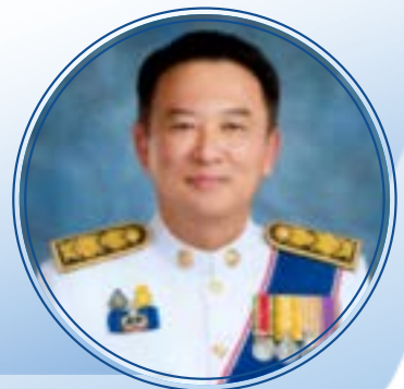
นายเดชา พุดกษัฒพัฒนรักษ์ รองปลัดกระทรวงแรงงาน กระทรวงแรงงาน