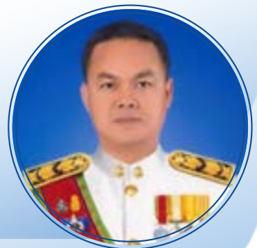
นายยงยุทธ นาควิโรจน์ รองอธิบดีกรมทรัพยากรน้ำบาดาล กรมทรัพยากรน้ำบาดาล กระทรวงทรัพยากรธรรมชาติและสิ่งแวดล้อม