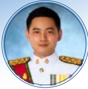
นายพรภัทร์ ต้นตึกุลานันท์ รองเลขานุการศาลอุทธรณ์คดีชำนาญพิเศษ ศาลอุทธรณ์คดีชำนาญพิเศษ ศาลยุติธรรม