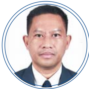
พลอากาศตรี ณิชพัชร์ เรืองมณีญาต์