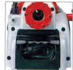
Cord pocket functions as hand grip, too.