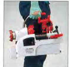
Easy to carry