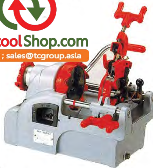
Manual-opening die head for NS25A