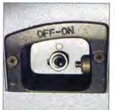
Switch protects die head from touching hand wheel