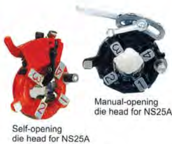
Self-opening die head for NS25A