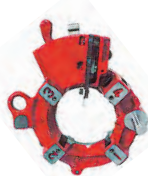
Self-opening die head (for 2 1/2"-3" pipe) NP80AVIII