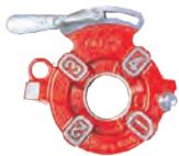
Manual die head (for 1/2"-2" pipe) NP80A