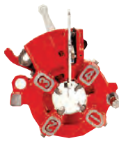
Uni-auto Die head