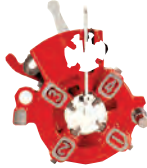
Uni-auto die head (for 1/2"-2" pipe) NP80AV/AVIII