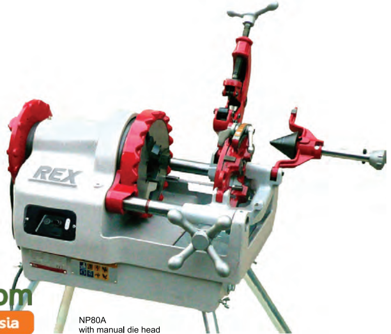
NP80A with manual die head