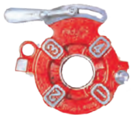
Manual Die head