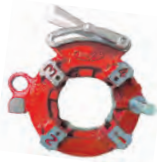
Manual die head (for 2 1/2"-3" pipe) NP80A/AV