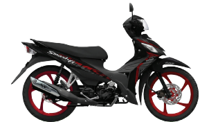
NEW TITAN BLACK