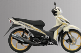
PEARL BRIGHT IVORY