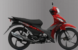
CDY.SUMMER RED NEW TITAN BLACK

เครื่องยนต์ขนาด 113 ซีซี แบบ SOHC สูบเดี่ยว 2 วาล์ว พร้อมระบบหัวฉีด และเทคโนโลยี Suzuki Eco Performance (SEP) ร่วมกับระบบหัวฉีด Suzuki Fuel Injection (FI) เพื่อมอบสมรรถนะที่ตอบสนองดี ควบคู่กับความประหยัดน้ำมันอย่างมีประสิทธิภาพ ช่วยให้การขับขี่ราบรื่น นุ่มนวล