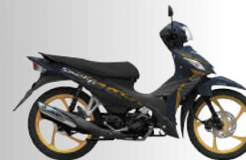
MET.MAT STELLAR BLUE