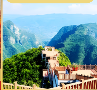
บันไดเลื่อนยักษ์เสินหนี่