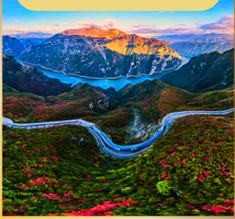
ถนนสวรรค์เทพริดา