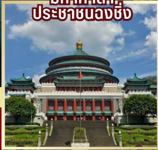
มหาวิทยาลัย ประชาชนฉงชิ่ง