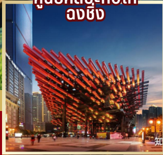
ศูนย์ศิลปะกั๋วไท่ ฉงชิ่ง