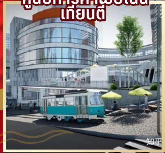
ศูนย์การค้าฝ้ายเงิน เทียนตี้