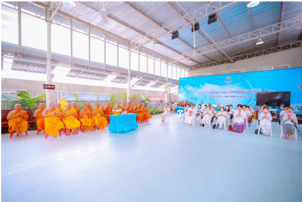
Participating in Ceremonies