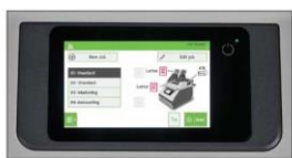
หน้าจอสี ระบบสัมผัส ขนาด 5 นิ้ว