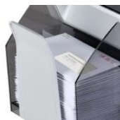
ถาดรองรับซองขนาดใหญ่