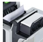
ถาดแทรกแผ่นพับ โบว์ชัวร์