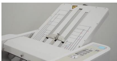
ปรับตั้งระยะพับด้วยระบบ manual ไม่ยุ่งยาก