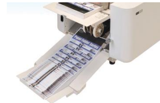
ถาดขาออกขนาดใหญ่