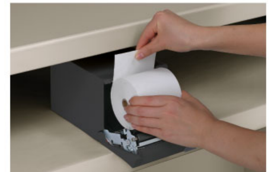
ชุดป้อนกระดาษด้านหน้าพร้อมที่ใส่ม้วนกระดาษ