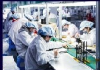
โรงงานอุตสาหกรรม