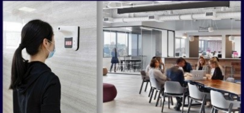
ออฟฟิศสำนักงาน