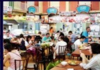
ห้างสรรพสินค้า/ร้านอาหาร