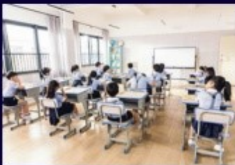
โรงเรียนสถานศึกษา