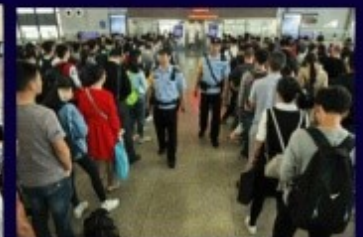
สถานที่ราชการ/ขนส่ง/สนามบิน