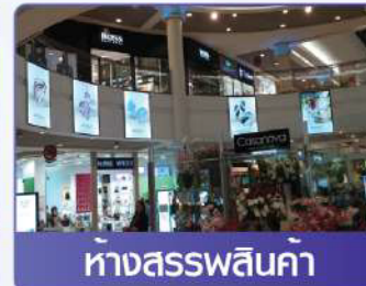
ห้างสรรพสินค้า