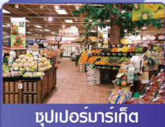
ซูเปอร์มาร์เก็ต