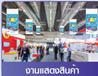
งานแสดงสินค้า