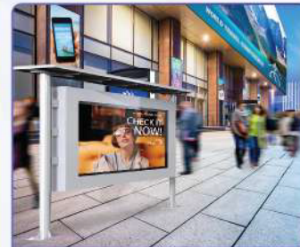
ห้างสรรพสินค้า