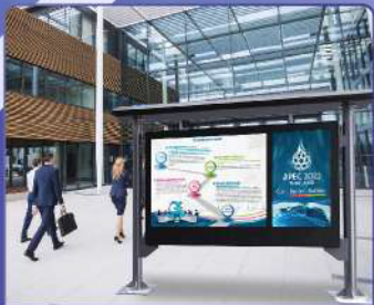
สถานที่ราชการ