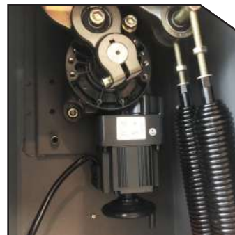
DC Motor 24V DC Motor