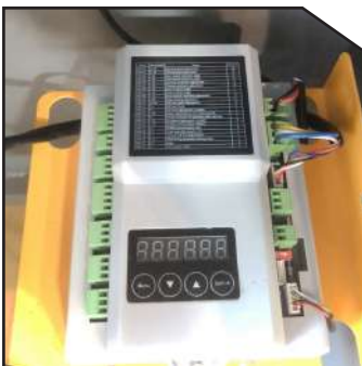
Muti-Function Control System with LED Display