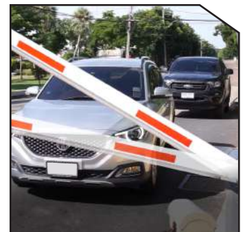
Barrier gate swing out and auto-reverse on obstacle, Protect barrier gate and car.