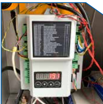
Multi-Function Control System with LED Display