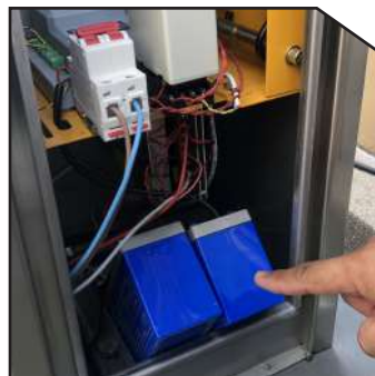
Backup battery keeps barrier running while power off