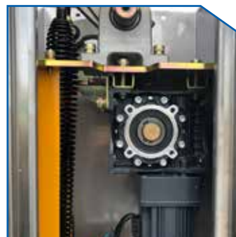
DC Motor 24V DC Motor