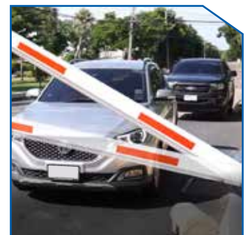
Barrier gate swing out and auto-reverse on obstacle, Protect barrier gate and car.