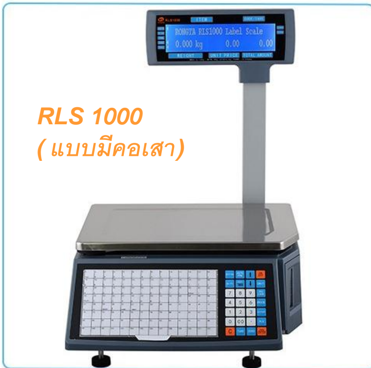
RLS 1000 (แบบมีคอสเสา)