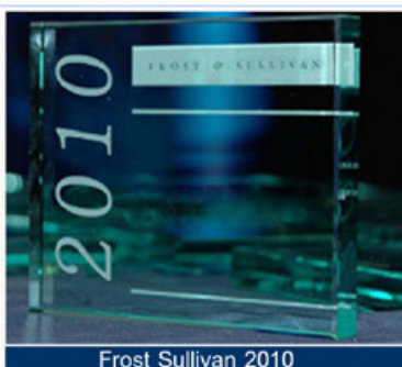
Frost Sullivan 2010