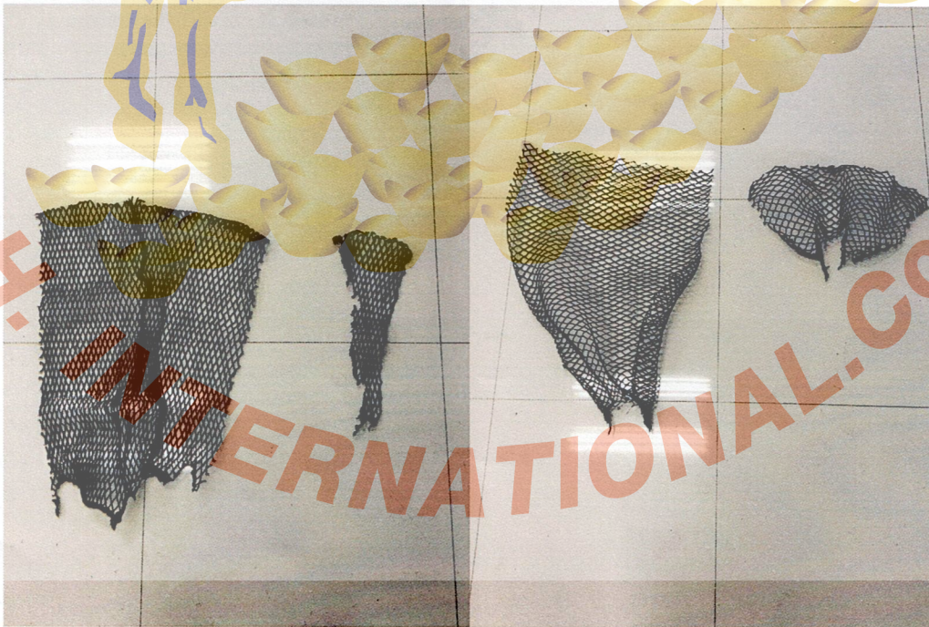
FIGURE 2 : G 3319-1/65 (AFTER TEST)