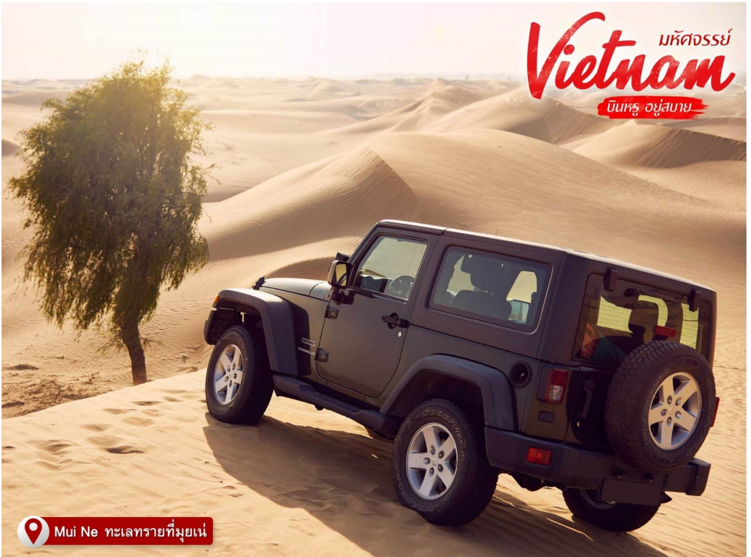
Mui Ne ทะเลทรายที่มุยเน่

จากนั้น เดินทางเข้าสู่เมือง ญัตรารง (ใช้เวลาเดินทางประมาณ 4 ชั่วโมง) เป็นเมืองชายฝั่งทะเลมีชายหาดอันสวยงาม เป็นที่ท่องเที่ยวสำคัญของเวียดนาม และเป็นศูนย์กลางการเมือง เศรษฐกิจ วัฒนธรรม และเทคโนโลยี ญัตรารงมีสภาพภูมิอากาศที่ดีและสามารถท่องเที่ยวได้เกือบทั้งปี และในด้านประวัติศาสตร์เมืองนี้เคยเป็นส่วนของอาณาจักรจามปา ซึ่งมีหลักฐานเป็นปราสาทหินแบบจามที่หลงเหลืออยู่