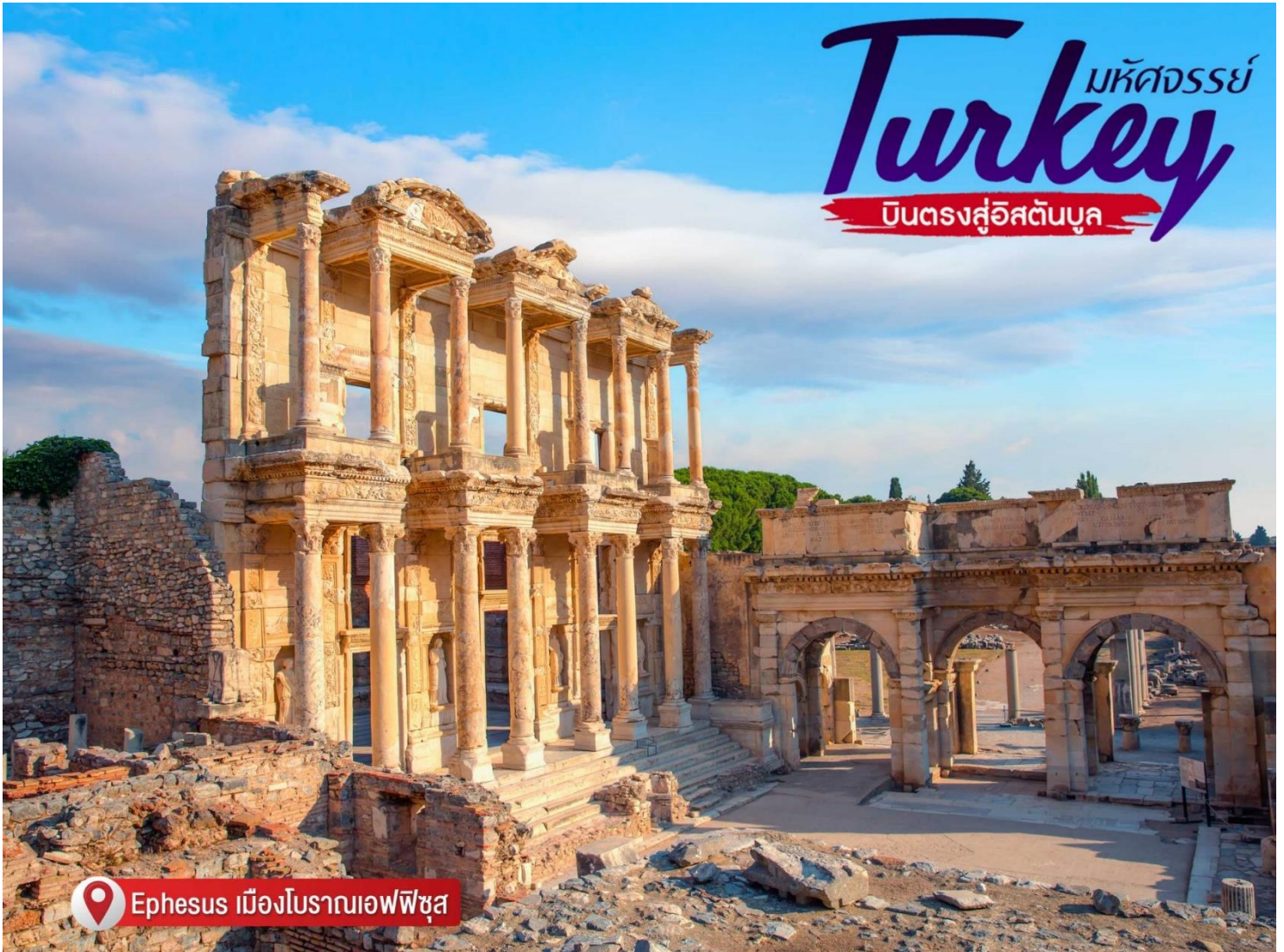
Ephesus เมืองโบราณเอเฟซุส

นำท่านเยี่ยมชม บ้านพระแม่มารี (House of Vergin Mary) เชื่อกันว่าเป็นที่สุดท้ายที่พระแม่มาริมาอาศัยอยู่และ สิ้นพระชนม์ในบ้านหลังนี้ตั้งอยู่บนภูเขาสูงเป็นสถานที่ศักดิ์สิทธิ์ที่คริสศาสนิกชนจะต้องหาโอกาสขึ้นไป นมัสการให้ได้สักครั้ง