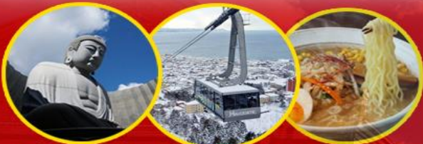
The Hill of the Buddha Hakodate มังกระเช้า หมู่บ้านราเมน