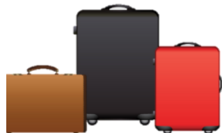
น้ำหนักกระเป๋า 20 กิโลกรัมต่อท่าน