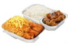
บริการอาหารร้อน ไป-กลับ บนเครื่อง ** เมื่อจากเมืองกลับถึง จึงมีอาหารเย็นรสเลิศบนเครื่องไว้ **