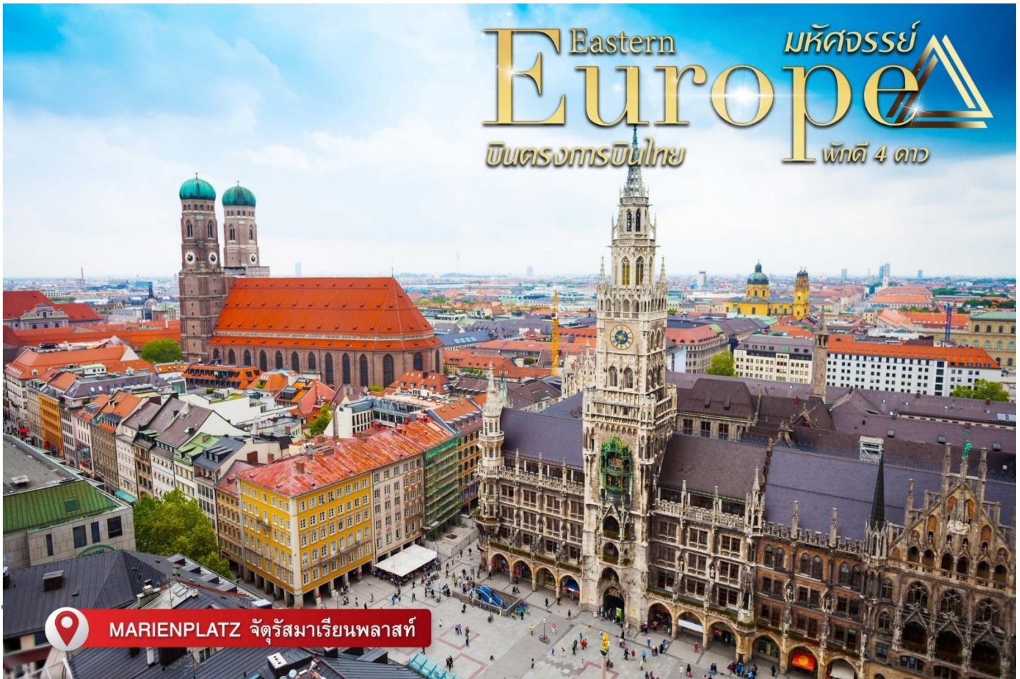
MARIENPLATZ จัตุรัสมาเรียนพลาซท์

จากนั้นเดินทางกลับสู่มิวนิค (MUNICH) ชมจัตุรัสมาเรียนพลาซท์ (MARIENPLATZ) ถือว่าเป็นจุดเริ่มต้นของประวัติศาสตร์และธุรกิจของนครมิวนิค บริเวณนี้เป็นที่ตั้งของศาลาว่าการเมืองที่มีรูปแบบสถาปัตยกรรมแบบโกธิคที่งดงามซึ่งสร้างขึ้นในช่วงปลายคริสต์ศตวรรษที่ 19 ใช้เวลาสร้างถึง 42 ปี มีหอรระฆังสูง 85 เมตร ซึ่งจะมีนักท่องเที่ยวรอดอยเฝ้าชมตึกคาไรลันที่จะออกมาเต้นรำ เมื่อนาฬิกาตีบอกเวลา 11.00 น. และ 17.00 น. อิสระท่านเลือกซื้อสินค้าแบรนด์เนม และของฝากตามอัธยาศัย