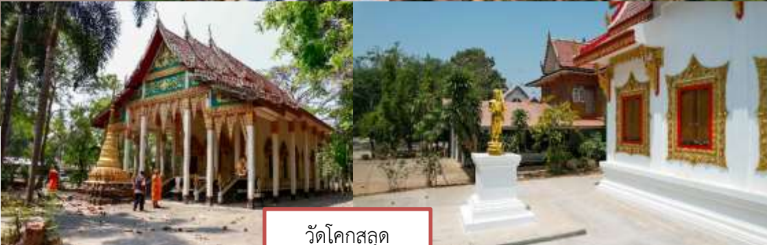
วัดโคกสลอด