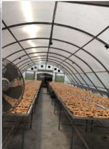
การทำกล้วยตากในท้องที่อำเภอบางกระทุ่ม