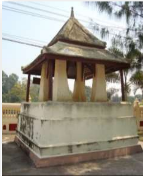
หอรขงบอรณวัดคอกสลด

ชุมชนที่มีความสำคัญและมีความน่าสนใจในอำเภอบางกระทุ่ม จังหวัดพิษณุโลก ซึ่งมีศักยภาพที่สามารถพัฒนาให้เป็นชุมชนน่าอยู่และสร้างสรรค์อย่างยั่งยืนตามแนวพระพุทธศาสนาได้จำนวน 4 ชุมชน ดังนี้