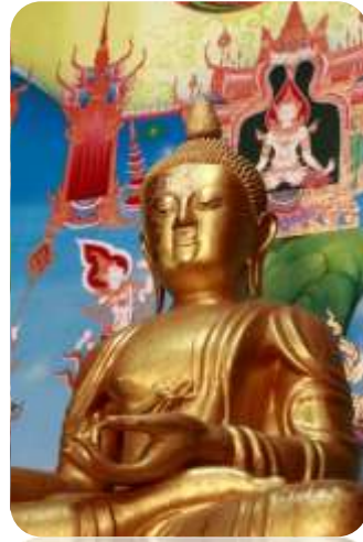
“หลวงพ่อเพชร” พระประธานปางฉันทสมอในโบสถ์วัดไพโรสุวรรณ

สำหรับความเป็นมาของพระพุทธรูปปางฉันทสมอนั้น เกิดขึ้นในรัชสมัยพระบาทสมเด็จพระนั่งเกล้าเจ้าอยู่หัว ทรงโปรดฯ ให้สมเด็จพระมหาสมณเจ้ากรมพระปรมานุชิตชิโนรส ทรงค้นคิดพระพุทธรูปปางต่างๆ ขึ้นอีก 34 ปาง โดยอิงเรื่องราวตามพุทธประวัติ หนึ่งในนั้นมีพระปางฉันทสมออันเป็นปางที่มาจากพุทธประวัติ ตอนหลังจากพระพุทธเจ้าตรัสรู้แล้วประทับเสวยวิมุตติสุขอยู่ 7 วัน เมื่อเสด็จออกจากสมาธิ ทำวสีกกเทวราชได้นำไม้สีพระทนต์กับผลสมอมาถวาย ทรงใช้ไม้สีพระทนต์และเสวยผลสมอนั้น พระบาทสมเด็จพระนั่งเกล้าฯ ยังได้โปรดฯ ให้ประดิษฐาน พระปางนี้ไว้ในหอพระสุลาลัยพิมาน วัดพระศรีรัตนศาสดาราม (วัดพระแก้ว) องค์หนึ่งด้วย พระฉันทสมอจัดเป็นพระพุทธรูปปางที่หาดูได้ยากปางหนึ่ง ทั้งยังมีพุทธศิลปะแบบจีนอีกด้วย ดังนั้นหลวงพ่อเพชรจึงนับเป็นพระพุทธรูปที่น่าชมและหายากองค์หนึ่งในประเทศไทย