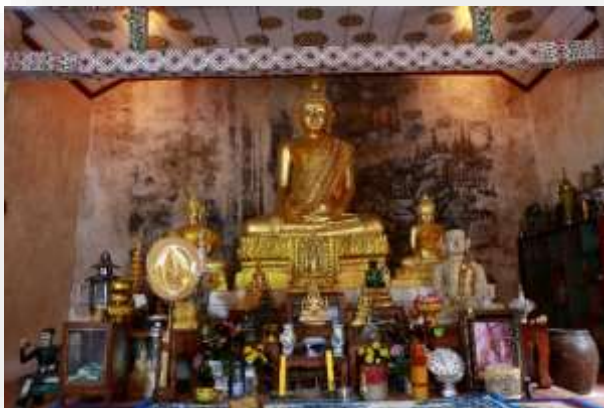
“หลวงพ่โต”