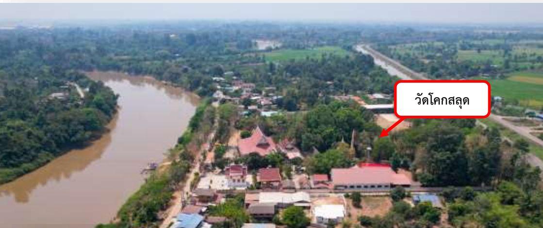
วัดโคกสลอด

ด้านหลังวิหารเป็นโบสถ์ ซึ่งสร้างขึ้นเมื่อปี พ.ศ.2500 โดยริ้อโบสถ์หลังเก่าออกแล้วสร้างโบสถ์หลังใหม่นี้ทับ จากการสอบถามชาวบ้านทำให้ทราบว่า ภายในโบสถ์หลังเก่ามีภาพจิตรกรรมฝาผนังเรื่องไตรภูมิ พุทธประวัติตอนมารผจญและเทพชุมนุมอยู่ด้วย คงเป็นจิตรกรรมศิลปะสมัยรัตนโกสินทร์นี้เอง แต่อายุโบสถ์เก่านั้นเมื่อดูจากใบเสมาหินชนวนที่เก็บรักษาไว้ในวัด คงสร้างขึ้นในสมัยอยุธยาตอนปลาย