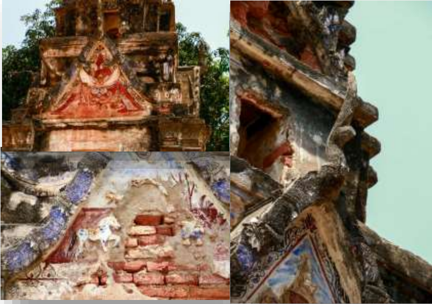
มณฑปทรงพระปรารักษ์แบบย่อมุมไม้สิบสองด้านหน้าโบสถ์วัดไพโรสุวรรณ

3. วัดโคกสลด อยู่ริมฝั่งแม่น้ำน่านทางทิศตะวันตก ในเขตบ้านโคกสลด ตำบลบ้านไร่ เป็นวัดโบราณน่าจะสร้างมาตั้งแต่สมัยอยุธยาตอนกลาง-ตอนปลาย เดิมชื่อ “วัดโคกสนุก” ต่อมาเพี้ยนเป็นวัดโคกสลด ภายในวัดมีโบราณวัตถุสถานที่ที่มีรูปแบบสถาปัตยกรรมสำคัญและน่าสนใจ เช่น วิหารเข้าใจว่าคงได้รับการซ่อมแซมมาหลายครั้งแล้ว เป็นอาคารทรงสูง ยกพื้นก่ออิฐฉาบปูน ตามผนังวิหารมีลายปูนปั้นประดับอยู่บ้างเล็กน้อย ภายในวิหารเป็นที่ประดิษฐาน “หลวงพ่โต” พระพุทธรูปปูนปั้นปางมารวิชัย ศิลปะพื้นบ้าน คงซ่อมแซมมาจากองค์เดิมที่น่าจะเป็นศิลปะอยุธยา และมี