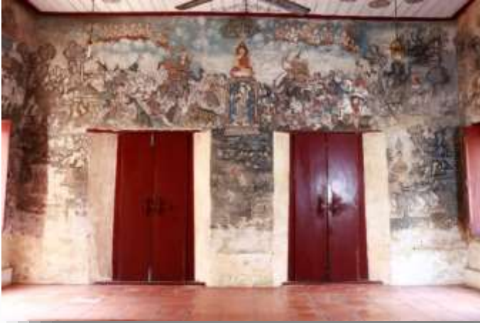
ประตูทางเข้าวิหาร

ผนังมุขด้านหน้าวิหารมีช่องประตูทางเข้าวิหาร 2 ช่อง ตรงกลางระหว่างช่องประตูเป็นภาพพระพุทธรูป และระหว่างช่องประตูทั้ง 2 กั้นริมผนังจะเป็นภาพพระอัครสาวกทั้ง 2 องค์ คือพระสารีบุตรและพระโมคคัลลานะ บนกรอบประตูเป็นลายปูนปั้นรูปสิงโตคาบดาบและลายพันธุ์พฤกษาประดับกระจก ที่เสาวิหารด้านหน้ามีลายปูนปั้นเป็นรูปทหารโปรตุเกสแบกปืนและจูงสุนัขประดับอยู่ 3 เส้า อีกเส้าหนึ่งนั้นลายปูนปั้นชำรุด