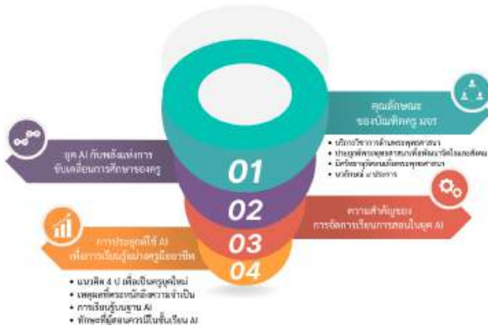
ภาพที่ ๔ พลิกโฉมบัณฑิตครู มจร สู่ความเป็นครูมืออาชีพในยุค AI