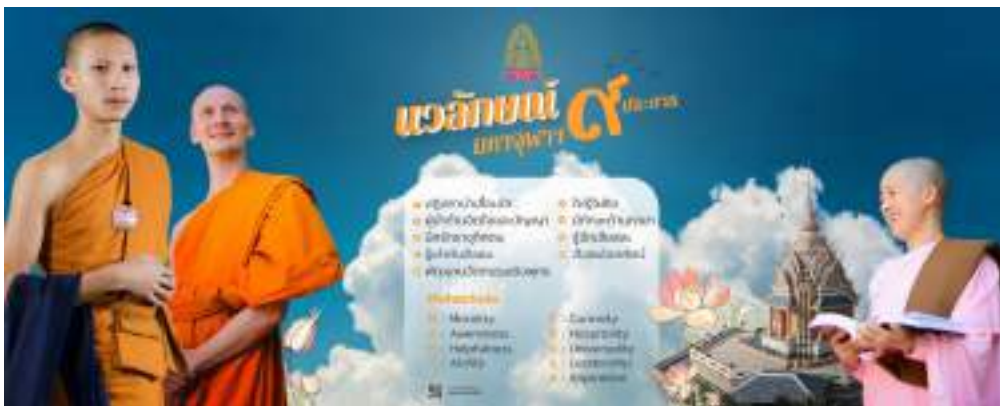
ภาพที่ ๑ วาลักษณ์ มหาจุฬาฯ ๙ ประการ

นอกจากนี้บัณฑิตครู มจร ต้องเป็นบุคคลแห่งการเรียนรู้แบบพุทธ เป็นบัณฑิตที่มีคุณภาพ ตามกรอบมาตรฐานคุณวุฒิระดับอุดมศึกษาแห่งชาติ โดยใช้หลักธรรมทางพระพุทธศาสนาบูรณาการ ในกระบวนการจัดการเรียนการสอน มีทักษะการเรียนรู้ในศตวรรษที่ ๒๑ และมีคุณลักษณะบัณฑิต ที่พึงประสงค์ตามวาลักษณ์ ๙ ประการ ดังนี้