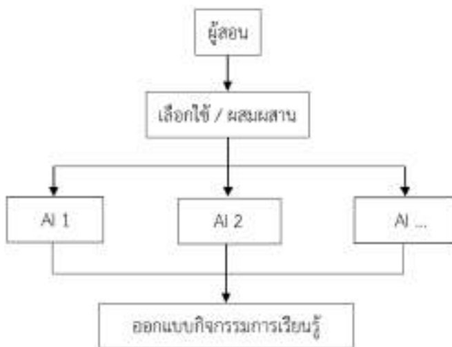
ภาพที่ ๓ AI – based Learning

สาระหรือ Concept มาช่วยในการจัดการเรียนรู้ เป็นต้น เพื่อให้ผู้เรียนเกิดการเรียนรู้อย่างถูกต้องรวดเร็ว และชัดเจน เช่น การใช้ Application “Star Chart” มาสนับสนุนการจัดการเรียนรู้ในหัวข้อแผนภูมิ ท้องฟ้าหรือแผนที่ดวงดาว เป็นต้น แสดงได้ดังภาพประกอบต่อไปนี้