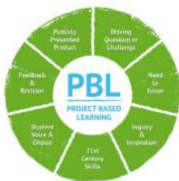
รูปภาพที่ 2 คุณลักษณะสำคัญของ PBL

2) การสอนแบบโครงงาน (Project Based Learning) โดยการสอนแบบโครงงานสามารถจัดเป็นกิจกรรมกลุ่มหรือกิจกรรมเดี่ยวก็ได้ ให้พิจารณาจากความยาก – ง่าย และความเหมาะสมขอโจทย์งาน และคุณลักษณะที่ต้องการพัฒนาวางแผนและกำหนดเกณฑ์อย่างกว้าง ๆ แล้วให้ผู้เรียนวางแผนดำเนินการศึกษาค้นคว้าข้อมูลด้วยตนเองโดยผู้สอนมีบทบาทเป็นผู้ให้คำปรึกษา จากนั้นให้นักศึกษานำเสนอแนวคิด การออกแบบชิ้นงานพร้อมให้เหตุผลประกอบจากการค้นคว้า ให้ผู้สอนพิจารณาร่วมกับการอภิปรายในชั้นเรียน จากนั้นผู้เรียนลงมือปฏิบัติทำชิ้นงาน และส่งความคืบหน้าตามกำหนด การประเมินผลจะประเมินตามสภาพจริง โดยมีเกณฑ์การประเมินกำหนดไว้ล่วงหน้าและแจ้งให้ผู้เรียนทราบก่อนลงมือทำโครงการ และมีการเชิญผู้ทรงคุณวุฒิร่วมประเมินผล (แนวทางการนิเทศเพื่อพัฒนาและส่งเสริมการจัดการเรียนรู้เชิงรุก (Active Learning) ตามนโยบายลดเวลาเรียน เพิ่มเวลารู้ 2562 หน้า 17)