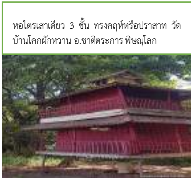
หอไตรเสาเดียว 3 ชั้น ทรงคฤห์หรือปราสาท วัดบ้านโคกผักหวาน อ.ชาติตระการ พิษณุโลก