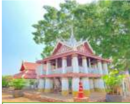
วัดราชบูรณะ พิษณุโลก : หอไตรเสากลม 16 ต้น ศิลปะสมัยสุโขทัย 2 ชั้น ทรงปราสาท หลังคาจัตุรมุข หน้าบันนกกครุฑยุคนาคและลายดอกไม้ปูนปั้น มีระเบียงอ่านหนังสือล้อมรอบ