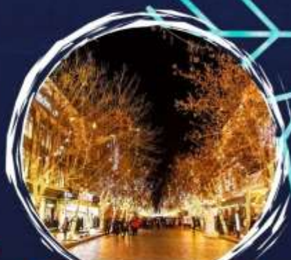
ขขขขขขขข