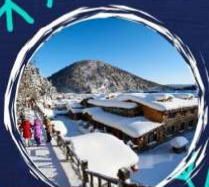
ขขขขขขข+ขขขขขขข