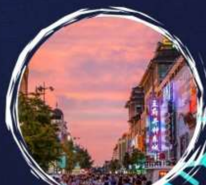
ขขขขขขขข