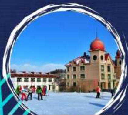
สขานสขกั้ขขขขข