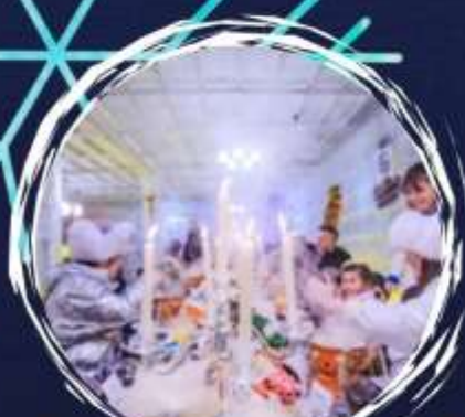
Suki Dome Ice