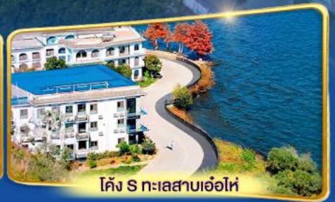
โค้ง S ทะเลสาบเอ่อไห่