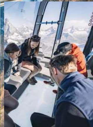
Matterhorn Glacier Paradise