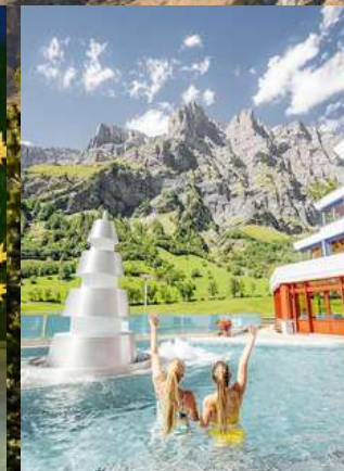
แช่สปปาลอยเคอร์บาด