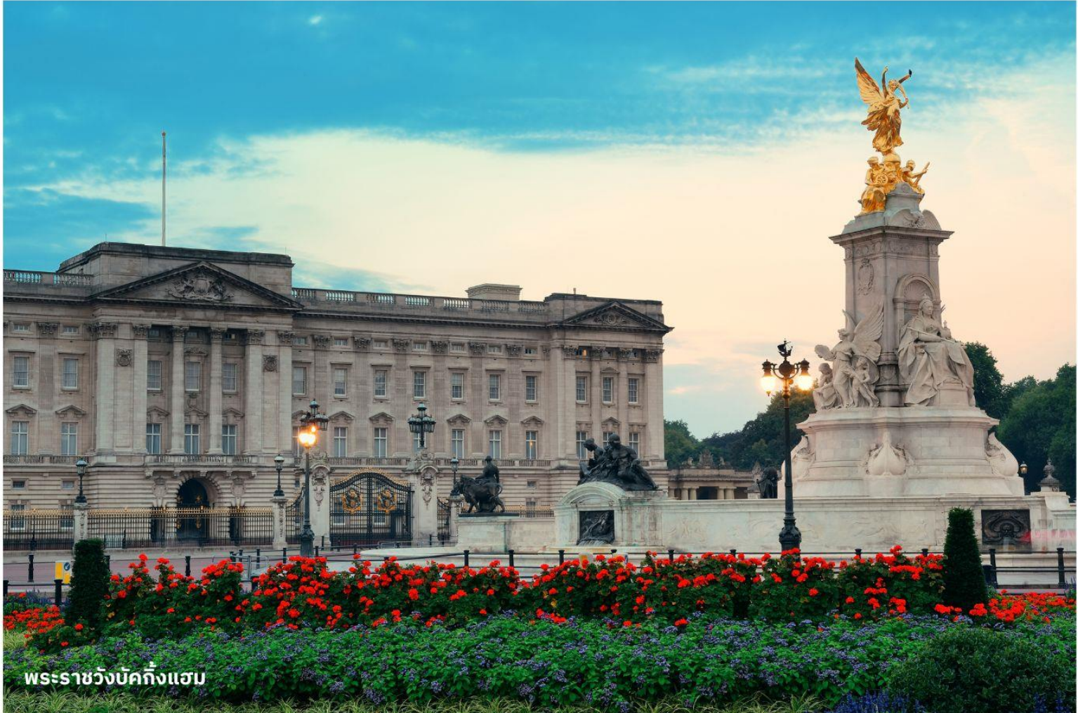
พระราชวังบักกิงแฮม

ได้เวลาอันสมควรนำท่านสู่สนามบิน เพื่อเตรียมตัวเดินทางกลับประเทศไทย