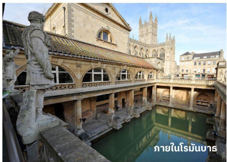
ภายในโรมันบาร