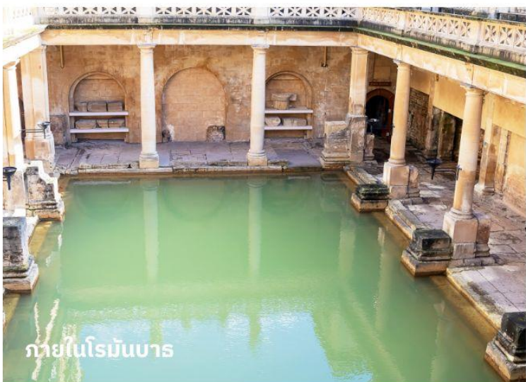
ภายในโรมันบาร