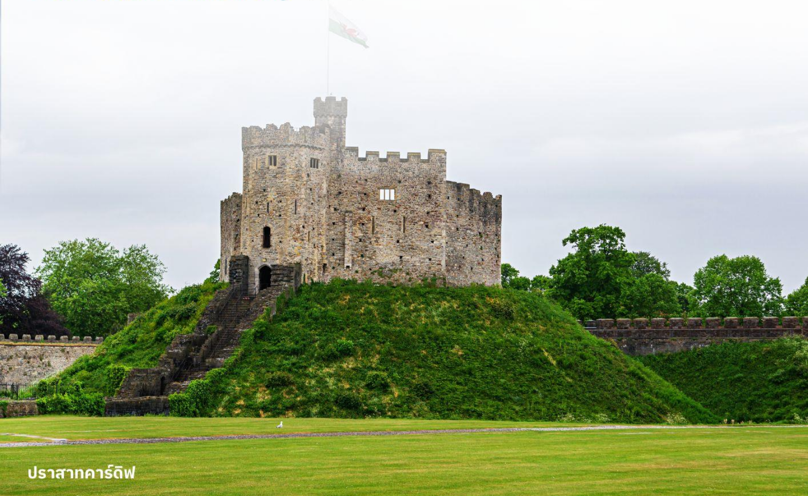
ปราสาทคาร์ดิฟฟ์

บริการอาหารค่ำ ณ ภัตตาคาร นำท่านเข้าสู่ที่พัก Hilton Garden Inn Bristol City หรือเทียบเท่า