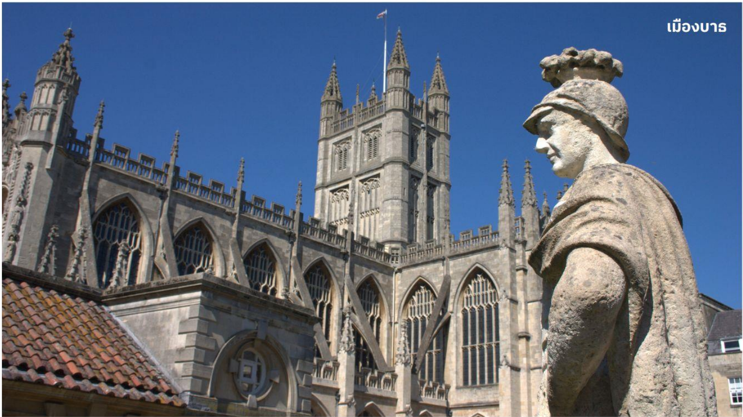
เมืองบาร

หลังจากนั้นนำท่านเดินทางสู่ เมืองบาร ดินแดนแห่งอาณาจักรโรมันอันยิ่งใหญ่บนเกาะอังกฤษเมื่อกว่า 2,000 ปีมาแล้ว ใช้เวลาเดินทางประมาณ 1.30 ชั่วโมง นำท่านเข้าชม โรงอาบน้ำแร่โรมัน ที่ชาวโรมันมาสร้างไว้เป็นสถานที่อาบน้ำแร่โดยอาศัยน้ำจากบ่อน้ำแร่ธรรมชาติที่จะมีน้ำไหลออกมาอย่างต่อเนื่องถึงวันละประมาณ 1,250,000 ลิตร และมีความร้อนถึง 46 องศาเซลเซียส ที่เมืองบารมี บ่อน้ำพุร้อนตามธรรมชาติ 3 แห่ง บ่อนที่ใหญ่ที่สุดคือที่ ROMAN SACRED SPRING น้ำพุจากใต้ดินลึก 3,000 เมตร มีแร่ธาตุถึงกว่า 43 ชนิด