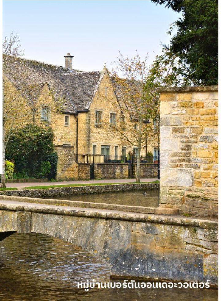
หมู่บ้านเบอร์ตันออนเดอะวอเตอร์

จากนั้นนำท่านเดินทางสู่ เขตคอตส์วอลส์ เขตหมู่บ้านชนบทแสนสวยของอังกฤษถึง 70 หมู่บ้าน ใช้เวลาเดินทางประมาณ 3.30 ชั่วโมง นำท่านเที่ยวชม หมู่บ้านเบอร์ตันออนเดอะวอเตอร์ (Bourton On The Water) หมู่บ้านเล็ก ๆ ที่รู้จักกันในนามของ “เวนิส แห่งคอตวอลส์” เมืองที่โด่งดังที่สุดในคอตส์วอลส์ ดูเจียบสงบบมีลำธารสายเล็ก ๆ (แม่น้ำวินด์ริช) ไหลผ่านกลางเมือง และมีสะพานหินทอดข้ามน้ำเป็นช่วง ๆ กับต้นวิลโลว์ที่แกว่งกิ่งก้านใบอยู่ริมน้ำ