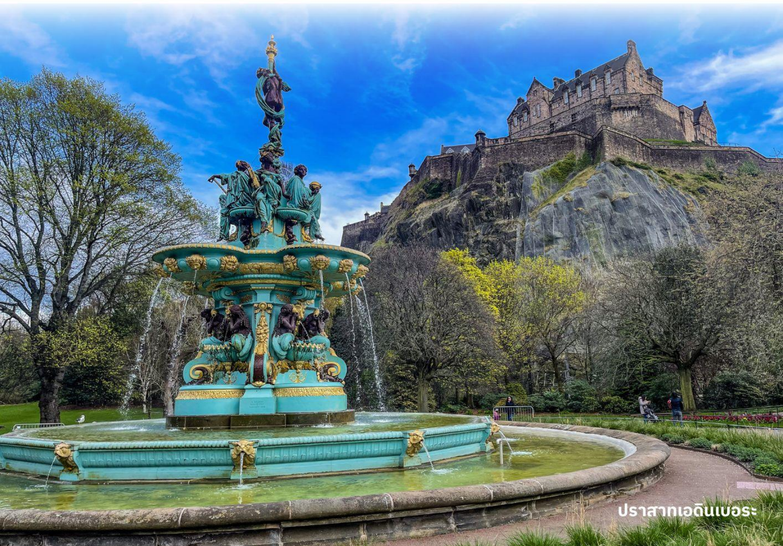
ปราสาทเอดินเบอระ

ผังตรงข้ามเป็นรัฐสภาแห่งชาติสก๊อตอันน่าทึ่งด้วยสถาปัตยกรรมร่วมสมัย