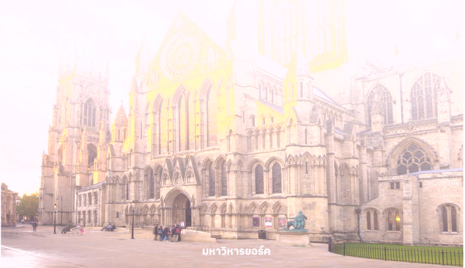
มหาวิหารยอร์ก

จากนั้นมุ่งท่ามเดิมทางสู่ เมืองยอร์ก ใช้เวลาเดินทางประมาณ 2 ชั่วโมง ไปนัมอริงเรมน์เบรานนี้ที่ขั้วงำแกงเมืองโบราณล้อมรอบ นำท่านถ่ายรูปด้านหน้า มหาวิหารยอร์ก หรือ ยอร์ก มินสเตอร์ (YORK MINSTER) มหาวิหารแห่งที่ยิ่งใหญ่ที่สุดในอังกฤษ เป็นโบสถ์แบบกอธิคที่ใหญ่ที่สุดในอังกฤษ เหนือ งดงามด้วยกระจกสีตกแต่งอยู่ภายในวิหาร และยังเป็นมหาวิหารแบบกอธิคที่ใหญ่เป็นที่สองรองจากมหาวิหารโคโลญจน์ในประเทศเยอรมนี จากนั้นนำท่านเดินต่อไปที่ The Shambles (เดอะแซมเบิล) เป็นสถานที่ที่มีความคล้ายกับตรอกไดอากอนในภาพยนตร์ชื่อดังอย่าง Harry Potter อีสาระให้ท่านเดินเลือกซื้อของที่ระลึกตามอัธยาศัย