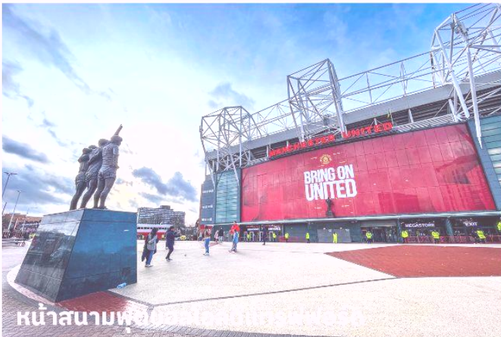
หน้าสนามฟุตบอลโอลด์แทรฟฟอร์ด