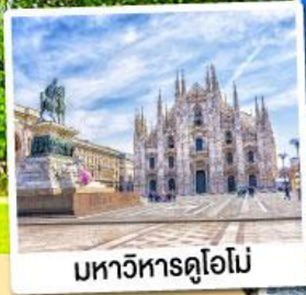
มหาวิหารดูโอโม

09-15 พ.ย. 67 28 ม.ค.-03 ก.พ. 68 12-18 มี.ค. / 11-17 เม.ย. 68 07-13 พ.ค. 68