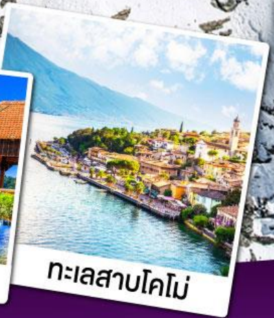
ทะเลสาบโคโม