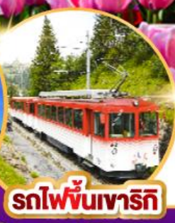
รถไฟขึ้นเขาริกิ

จำๆ สวนคอยเคนฮอฟ เทศกาลทิวลิปใหญ่ที่สุดปีละครั้ง กับ ฝรั่งเศสน้อยแห่งอัลซาส