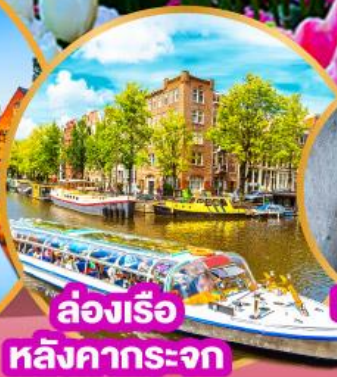
ล่องเรือ หลังคากระจก