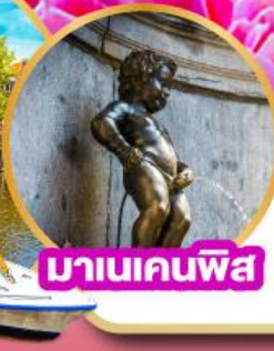
มานเคนพิส