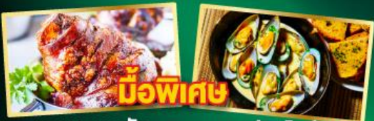
มือพิเศษ พาหมูเยอรมัน หอยแมลงภู่อินจาว