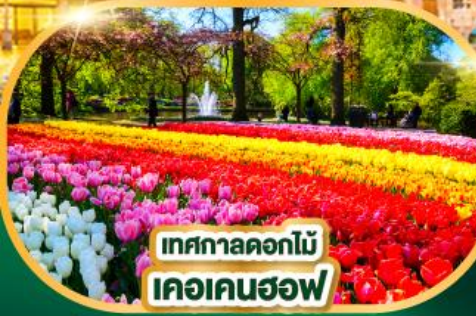
เทศกาลดอกไม้ เคอเคนฮอฟ