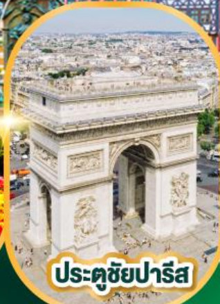
ประตูชัยปารีส