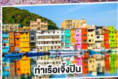
ท่าเรือเจ๋งป็น