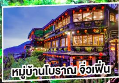
หมู่บ้านโบราณ จ๊วเพื่อน