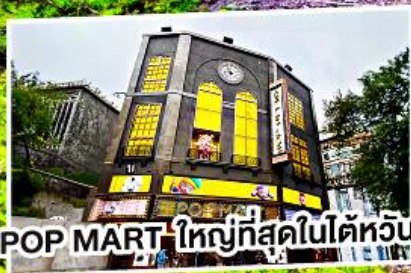
POP MART ใหญ่ที่สุดในไต้หวัน