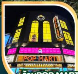
ร้านPOP MART ที่ใหญ่ที่สุดในไต้หวัน