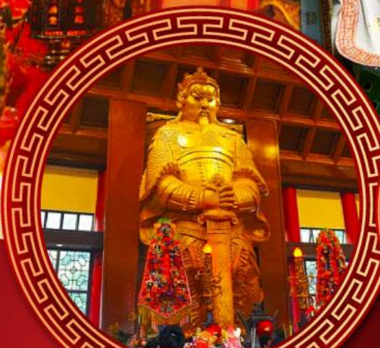
วัดแซกงหมิว