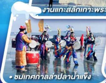
ชมเทศกาลสเก็ตน้ำแข็ง