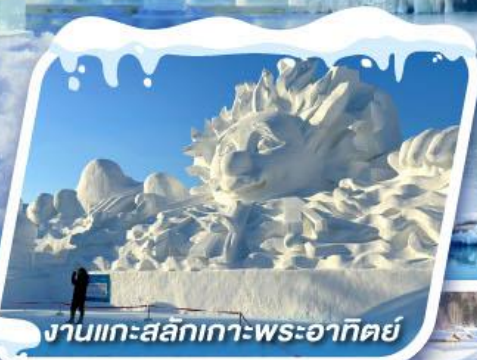
งานแกะสลักเกาะพระอาทิตย์