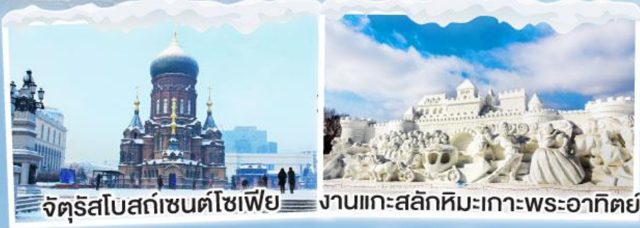
จัตุรัสโบสถ์เซ็นต์โซเฟีย งานแกะสลักหิมะเกาะพระอาทิตย์