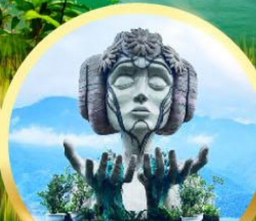
โมนาน่า ซาปา คาเฟ่