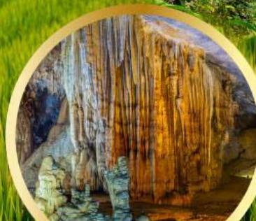
ถ้ำสวรรค์