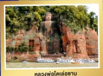
หลวงฟ่งโตเล่อซาน