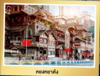
หยงหยาดัง