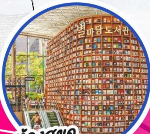
ห้องสมุด Starfield Library